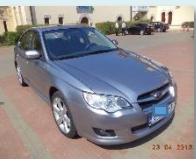
Diagonala dreapta - față